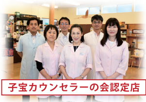
子宝カウンセラーの会認定店